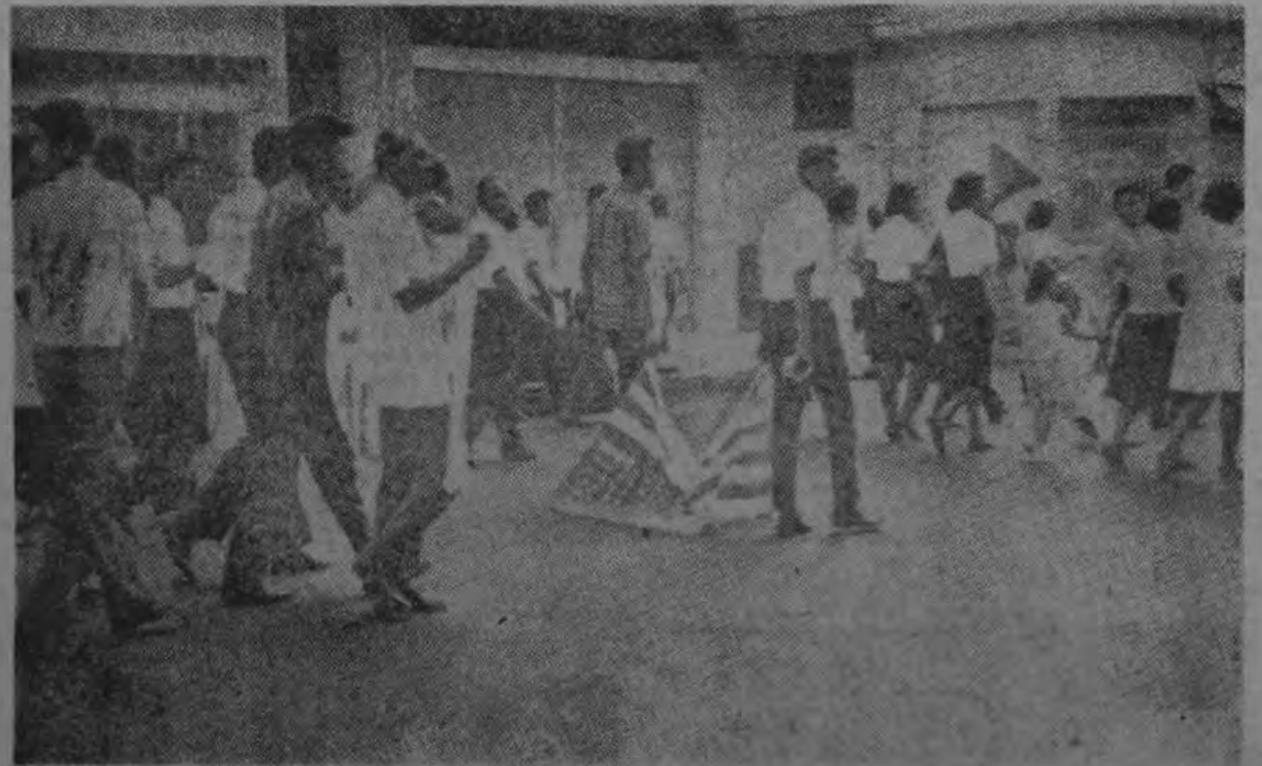
Varios manifestantes panameños, durante manifestaciones del domingo y el lunes pasados, arrastran por el suelo una bandera norteamericana...